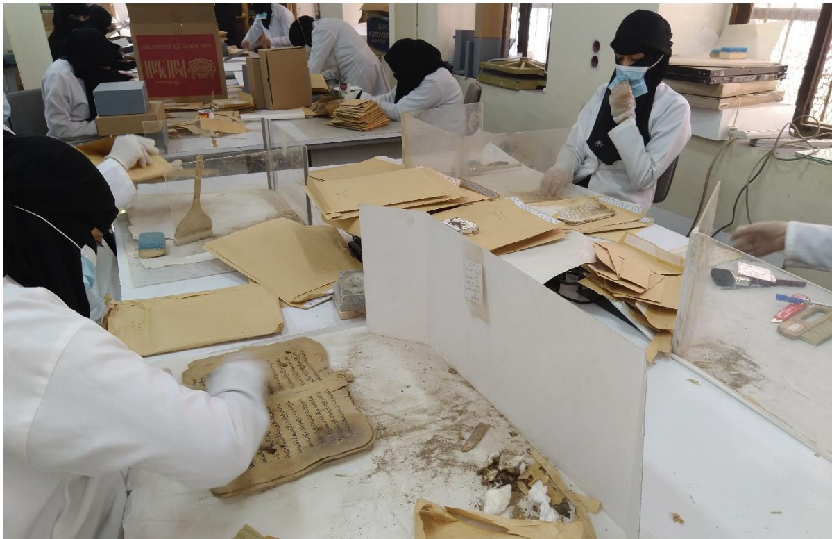
أعمال الترميم والصيانة في دار المخطوطات بصنعاء، اليمن، 2020.

بمجرد أن يتم فحص المباني من الداخل والخارج وهي آمنة، لا يزال عليك رعاية المقتنيات (المجموعات) بعد الإغلاق الكامل للمؤسسة. وخلال هذا الإطار الزمني غير المحدد، تظل المقتنيات متروكة، مما يزيد من خطر التدهور العام الناجم عن البيئة والملوثات والآفات، فضلا عن انخفاض مستويات المراقبة الوقائية والمكافحة. وفي حين أن المجموعات ليست معرضة لخطر