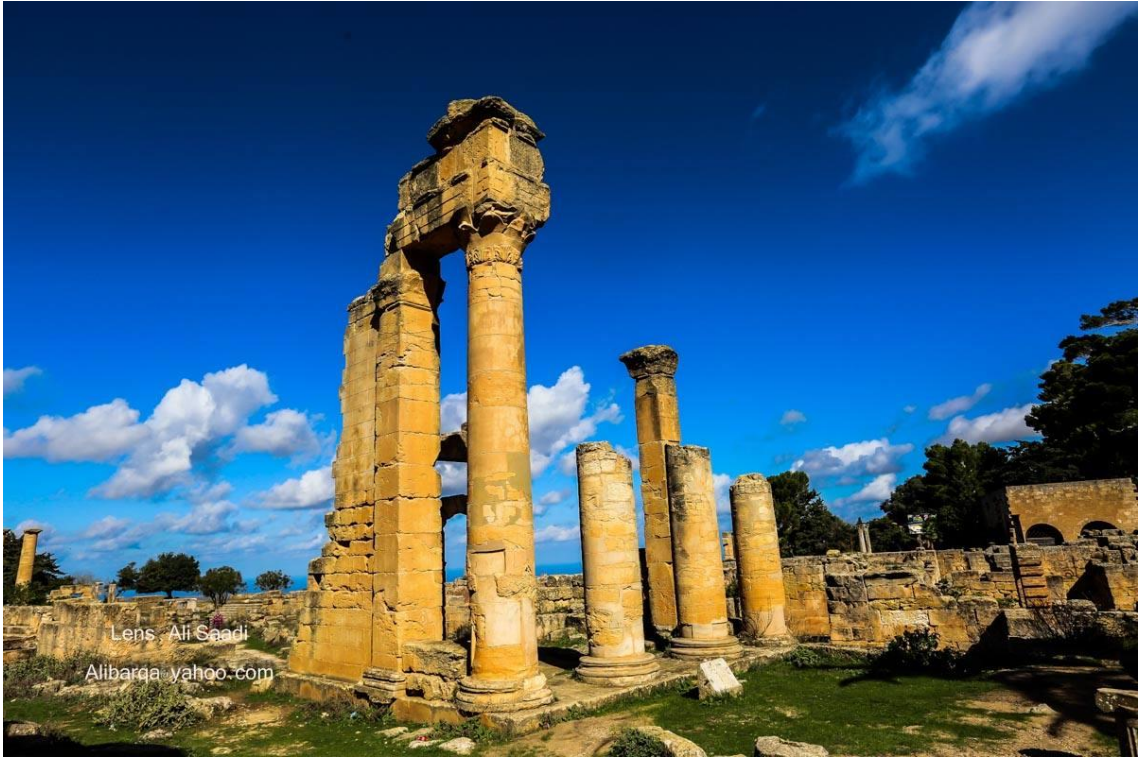
بروبلايوم روماني، شحات ، مدينة" قورينا".

بالنظر إلى 42 عامًا من الإهمال في عهد الرئيس السابق القذافي وما يقرب من 10 سنوات من العنف واسع النطاق فليس من المستغرب أن يعاني التراث الثقافي من الإهمال وقلة الوعي من قبل الحكومات الحالية وعامة الناس، فمن الصعب معالجة قضايا الحفاظ على التراث الثقافي عندما تواجه البلاد عدم استقرار والحكومة منشغلة بمخاوف أخرى.