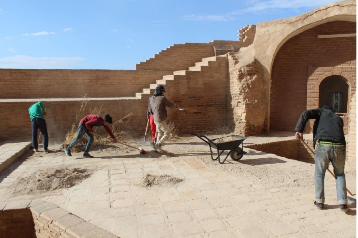
قلعة جعبر ، الرقة ، 2018.

تم استئناف العديد من مشاريع الترميم، مثل ترميم الجامع الأموي الكبير في حلب و ترميم الأسواق في حلب.