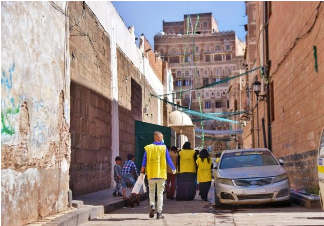
حملة توعية عن مخاطر كوفيد-19، مؤسسة سند، 2020. © ورده الجراي.

ومن النتائج المأساوية الأخرى لهذا الوباء الوفيات العديدة التي شهدتها موظفو التراث والباحثون الذين كانوا جميعاً من حافزي المعرفة والخبرة التراثية. ومن الصعب إيجاد البديل عنهم. إن رحيل الحرفيين والنساء اللاتي يعملن منذ زمن طويل في التقاليد التي تُسَلَّم من جيل إلى جيل قد أضعف قطاع الفنون والحرف اليدوية بشكل كبير، وأدى إلى انخفاض عدد من الأسر إلى مستوى الفقر. وكغيرها، يتمتع الموظفون في مجال التراث والفنون والحرف عن ممارسة مهنتهم خوفاً من الإصابة. وفي أحد تقارير صحيفة الشرق الأوسط 4 ، اتهمت حكومة عدن الحوثيين بالعبث بالمخطوطات القديمة، مثل المخطوطات الواردة من المسجد الكبير في صنعاء، والاستيلاء على قواعد البيانات، وفصل الموظفين المؤهلين للحفاظ على الآثار واستبدالهم بغير المتخصصين والمولين. ودعت وزارة الثقافة اليونسكو إلى التدخل ووضع حد للسلوك الحوثي المنهجي والمدمر. كما أن إلغاء الندوات الثقافية والأحداث الثقافية يعرض التراث غير المادي للخطر، وهو أمر بالغ الأهمية في الثقافة اليمنية. وفي الوقت نفسه، ألغيت أعمال الحفاظ على التراث الثقافي، والحلقات الدراسية، والمحاضرات، وأصبح دعم منظمات التراث الدولية مسألة ملحة الآن أكثر من أي وقت مضى.