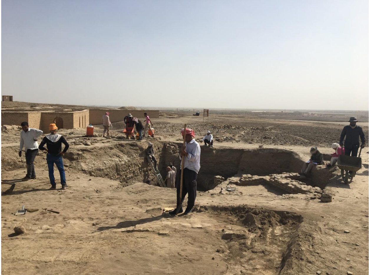
أعمال التنقيب في موقع أور، محافظة ذي قار، العراق، 2017.

كان لغزو العراق من قبل التحالف في عام 2003 العديد من الآثار السلبية على التراث الثقافي العراقي. واستمرت معاناة تراث البلاد خلال السنوات التي أعقبت الحرب حيث أدى العنف المستمر، وبشكل خاص من قبل داعش إلى إلحاق الضرر بالتراث الثقافي بشكل متواصل. كما أدت السياسات الطائفية منذ عام 2003 إلى تآكل المؤسسات الحكومية المعنية بالتراث التي من المفترض أن تتنافس باستمرار مع الأوقاف الدينية الغنية 7 . في الوقت الحالي أدى الإرتفاع المستمر للإصابات المؤكدة والوفيات بسبب كوفيد-19 إلى سحب المصادر من القطاعات الأخرى، مما جعل قطاع التراث يكافح من أجل البقاء.